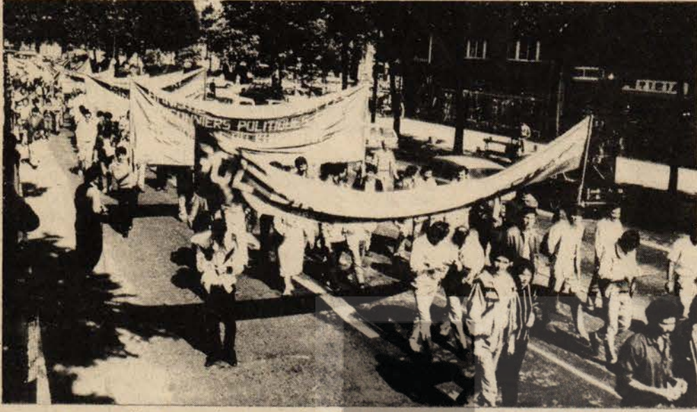
12 EYLÜL ASKERİ DARBESİ BATI AVRUPA'DA PROTESTO EDİLDİ.