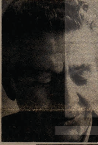
Ruhi Su Sızı Sesi Kavgası ile halkın bilincinde yaşiyor